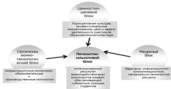
Рисунок 1 – Модель образовательной среды

7.4.8 Иллюстрации каждого приложения обозначают отдельной нумерацией арабскими цифрами с добавлением перед цифрой обозначения приложения. Например, Рисунок А.3.